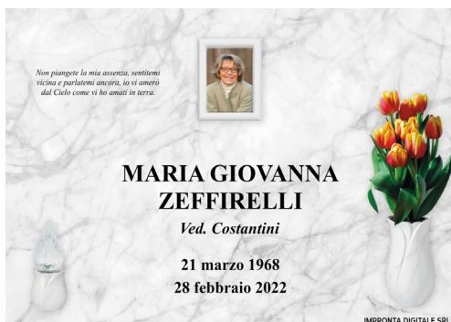
Pilla Perla 196 Mc