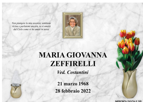
Pilla Perla 196