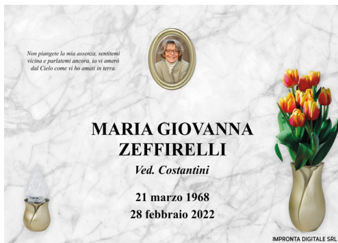
Pilla Perla 195