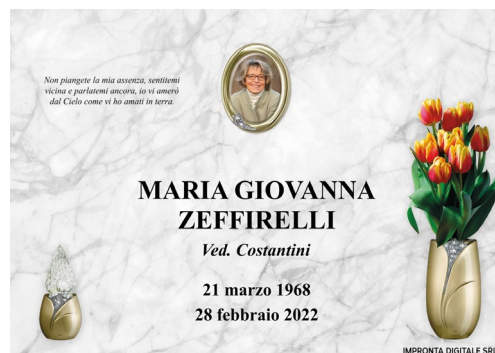
Pilla Gemma Reale 277