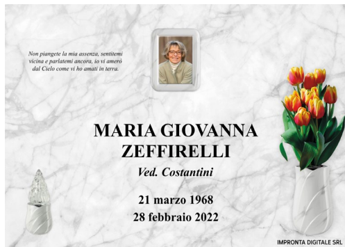
Pilla Floris 272 Mc