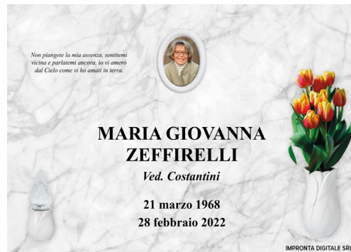
Pilla Perla 195 Mc