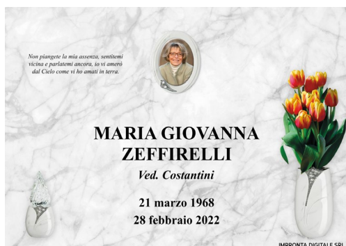
Pilla Gemma Reale 277 Mc