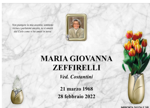
Pilla Gemma Reale 278