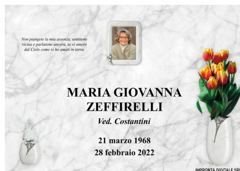
Pilla Gemma Reale 278 Mc