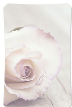
Immagine di fondo: