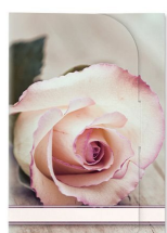
Immagine di fondo:

Busta: NO SI (Carta comune bianca 75x112mm)